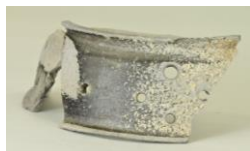
8次調査で発掘された「円面硯」