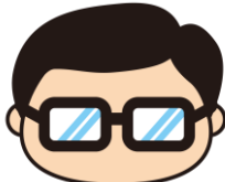
岩沼市マスコットキャラクター 岩沼係長