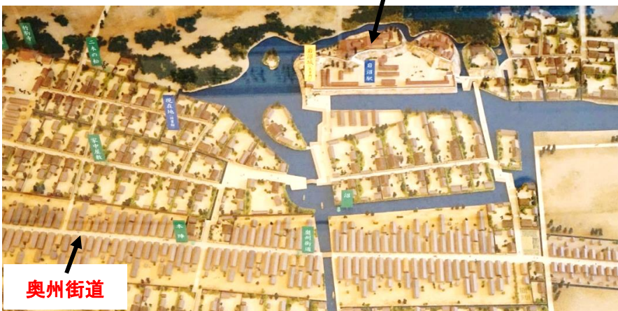
ふるさと展示室のジオラマ