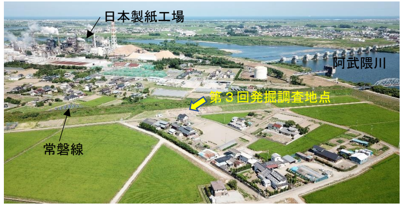
原遺跡を上空から見た写真

では、玉前の駅家は岩沼のどのあたりにあったのでしょうか。南長谷の阿武隈川に近い場所で発掘調査が行われ、これまでに例がないほどの大量の土器が発見されました。土器以外にも