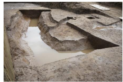
L字に曲がった大きな溝

釉薬(つやを出し、水の染み込みを防ぐ薬品)が塗られた陶器で現在の愛知県などでつくられたもの。役所などの機関で使用された。