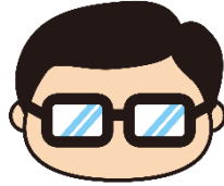
岩沼市マスコットキャラクター 岩沼係長