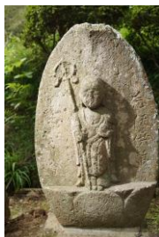
じぞうぼさつぞう ④地蔵菩薩像