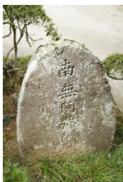
みょうごうひ ③名号碑