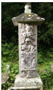
しょうめんこんごうぞうとう ⑦青面金剛像塔