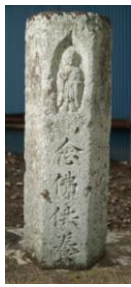
ねんぶつこうとう ⑤念仏供養塔