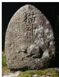
ねこがみひ ①猫神碑