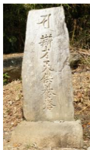
べんざいてんくようとう ⑧辯才天供養塔