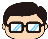
岩沼市マスコットキャラクター 岩沼係長