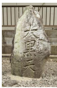
だいくてんひ ⑥大黒天碑