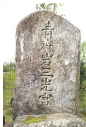
あおそいわさんこうぐうひ ②青麻岩三光宮碑