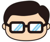
岩沼市マスコットキャラクター 岩沼係長