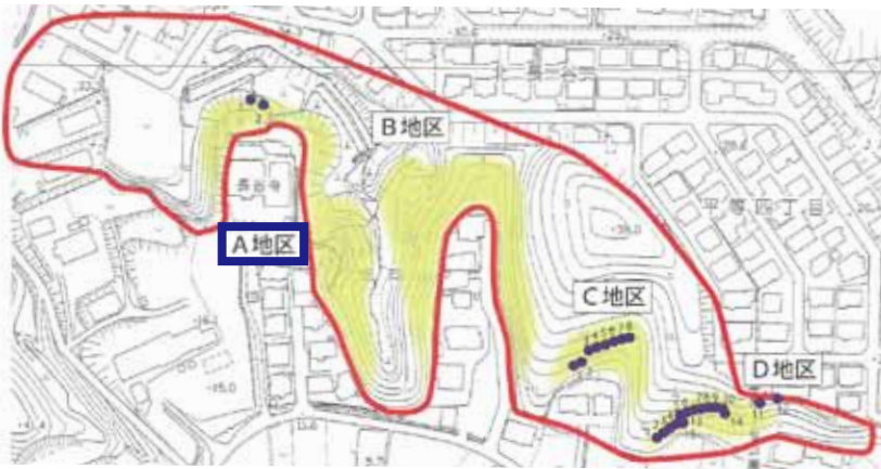
長谷寺横穴墓群のA地区の様子

岩沼市内発掘調査が行われている「長谷寺横穴墓群」について「速報版」で情報をお知らせします。横穴墓は丘陵の斜面に穴を開け遺体を安置したお墓で、長谷寺横穴墓群は、7世紀中頃～8世紀前半頃につくられました。急傾斜地崩壊対策工事にともない令和8年4月より調査を開始し、現在A地区で見つかった横穴墓から調査しています。横穴墓を覆っていた表土を取り除いていくと土器などの遺物が見つかりました。