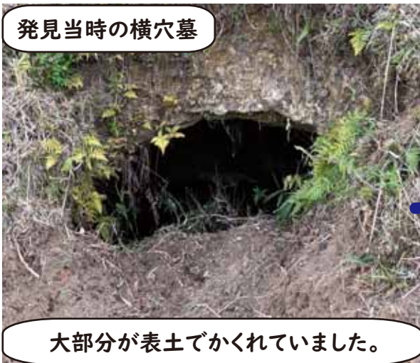
発見当時の横穴墓

ぜんていぶ 前庭部…横穴墓の入口 せんもん せんどう 羨門…羨道の入口 げんしつ 羨道…入口から玄室までの通路 げんもん 玄門…玄室への入口。 ひつぎ あんち 玄室…棺に遺体を入れて安置する部屋