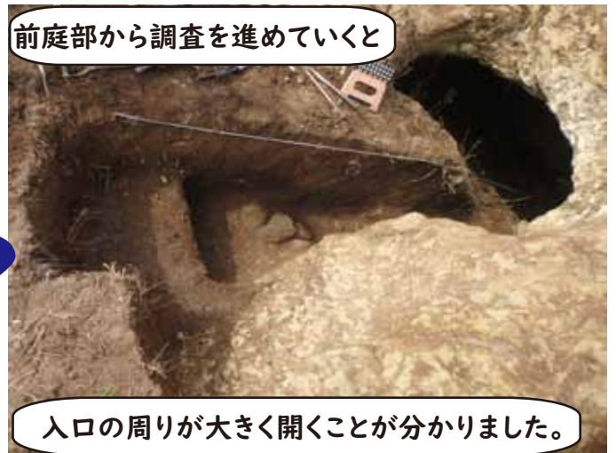
前庭部から調査を進めていくと